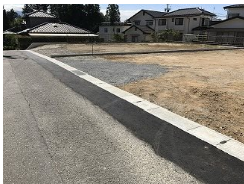
上郷まちづくり条例